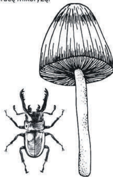
Kolejna część w następnym numerze DK!

Porosty zadomowiły się na korze drzew, na glebie. Mchy porosty najniższe partie lasu, chłonąc i przetrzymując wodę niczym gąbki. Wilgoć i ciepło zatrzymywane przez las stworzyły mikroklimat pozwalający na dalszy rozwój lasu. Wzrastały paprocie, widłaki i skrzypy. W niższych i bardziej odkrytych miejscach pojawiły się dywany, konwalie i zawilce wykorzystując pierwsze promienie wiosennego słońca i brak liści. Ich życie jest krótkie, gdy konary zazielenią się, liście zatrzymują dopływ światła, kwiaty zamierają i czekają na kolejną wiosnę. Pozostają tylko bluszcz i kopytnik bardziej wytrzymałe na brak światła.