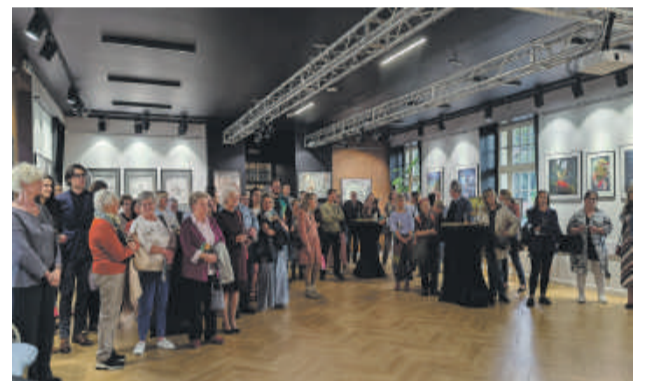
Mieszkańcy Świeradowa-Zdroju i okolic tłumnie przybyli na wernisaż.

Więcej zdjęć z tego niezapomnianego wydarzenia kulturalnego można obejrzeć na stronie: www.swieradowzdroj.pl zakładka Galeria