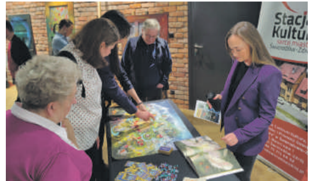
Regionalnej grze planszowej VisitKarkonosze, której szatę graficzną stworzyła Matylda Konecka można było przyjrzeć się z bliska.